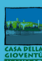
CASA DELLA GIOVENTÙ MANIAGO