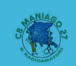
CB Maniago 27 & Radiatori Maniago