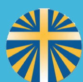
Azione Cattolica Italiana Diocesi di Concordia-Pordenone Parrocchia di Maniago