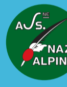
Associazione Nazionale Alpini Gruppo Maniago