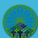
Cooperativa S. Mauro Maniago

con il contributo dell'IMPRESA EDILE DEL MISTRO GIACOBBE Spa