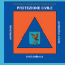
Protezione Civile FVG Comune di Maniago