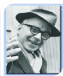
Il testimone Giorgio La Pira

Il Testimone che accompagnerà i nostri giovanissimi durante il campo è Giorgio La Pira, figura poliedrica e virtuosa tra i nostri santi e beati; un laico impegnato in politica e un grande operatore di pace, la cui ispirazione più grande era «quella di pregare, di meditare, di studiare, di consolare: insomma essere una lampada viva di interiorità».